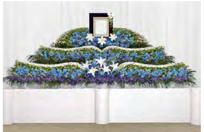
オリジナル花祭壇