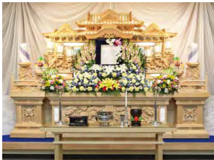
白木三段祭壇 生花飾付