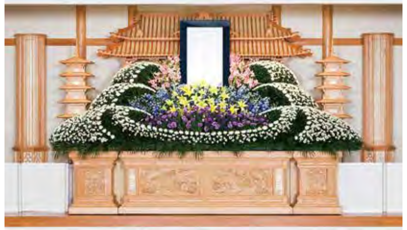
白木四段祭壇 五重塔 円筒 生花飾付