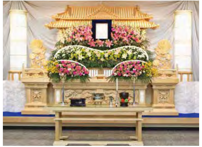
白木四段祭壇 円筒 生花飾付