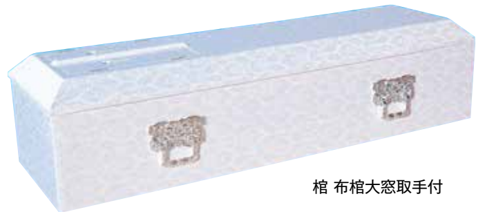
棺 布棺大窓取手付