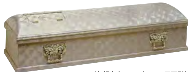
棺 銀富士またはインロー五面彫刻