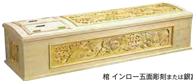
棺 インロー五面彫刻または銀富士