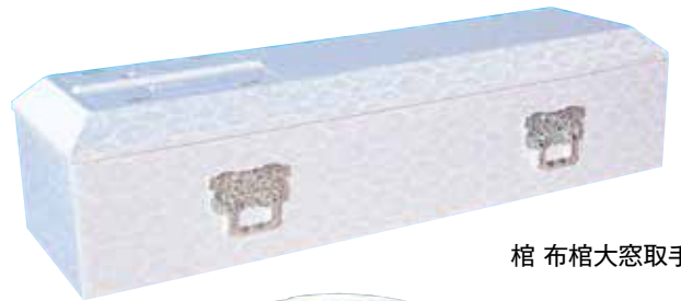
棺 布棺大窓取手付