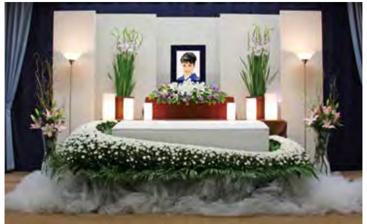
オリジナル花祭壇