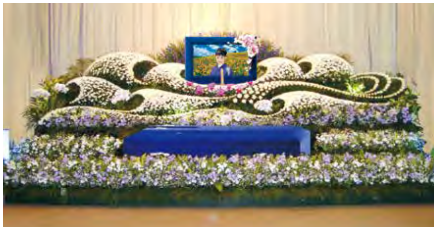
オリジナル花祭壇