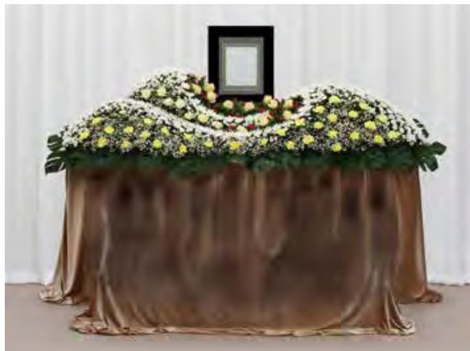
オリジナル花祭壇