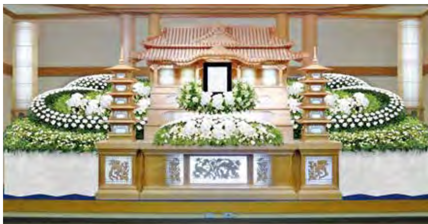
輿付生花スロープ祭壇 円筒 生花飾付