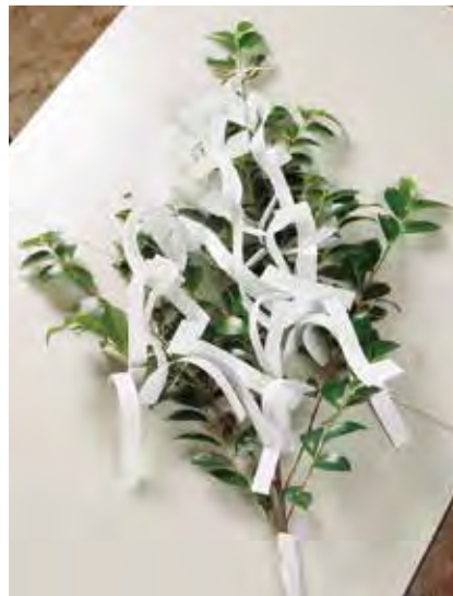
大祓い 1,000円 + 消費税