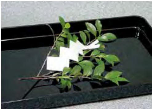
玉串 250円 + 消費税