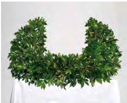
神写真前 15,000円 + 消費税