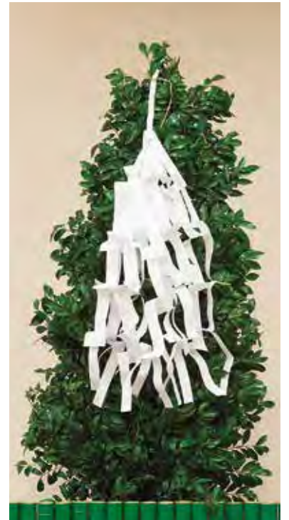
大神(1対) 50,000円 + 消費税